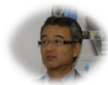
成田検査・技術委員長