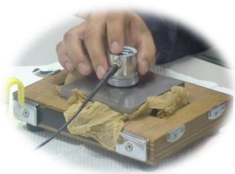
試験片による超音波探傷